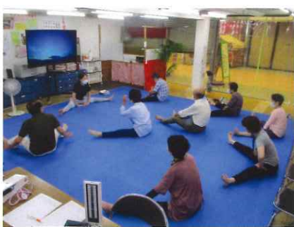
運動のあとはお菓子やお茶で一休み