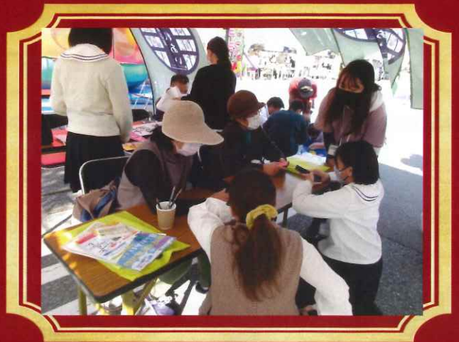
みんなの健幸・福祉のつどいへ参加し 高校生と大学生と一緒に高齢者へスマ ホ普及の地域活動を行いました