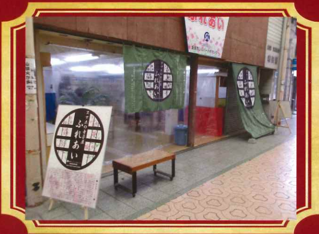
会員専用・スマホ教室開設しました