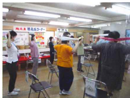
飯塚市の保健師さん大人気!

シルバーセンターが大好評で行う健康教室が、大変好評です。毎月全国のシルバー人材センターに紹介されています。