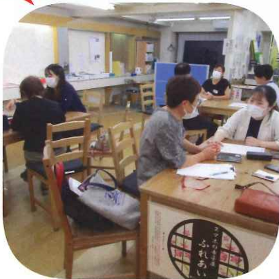
九工大の学生さんがやさしく丁寧に指導する寺子屋の様子