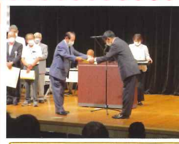
令和五年度安全優良センター表彰

◆安全適正就業委員会より 昨年度は安全講習会を開催し、結果として、前年度と比較し、様々な安全対策を講じたことにより、減少傾向にあります。特に、石川地区の発生件数は、前年度より減少傾向にあります。また、二名が死亡したという深刻な結果も、安全意識の向上が功を奏したと見られます。 安全就業会議・飯塚署による安全講話