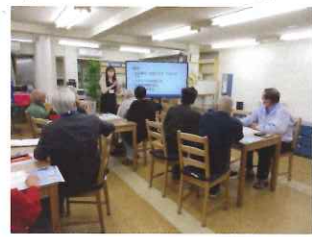
九工大学生による講習会