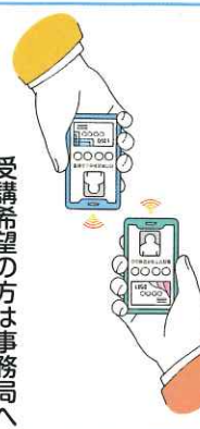
受講希望の方は事務局へ

配分金明細や就業募集情報、お知らせや案内（総会や講習会等）なども閲覧できセンターではスマートフォン講習会にて初心者から会員クラウドサービスの操作方法の指導取り組みを行っていますのでぜひ受講して下さい。尚スマホ・タブレット所有の方に限ります。 ※会員番号と紐づいているので覚えやすいです