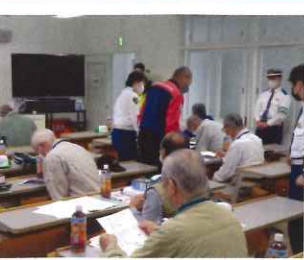
適正検査で診断しました