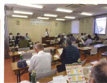
安全就業会議・飯塚署による安全講話

定時総会後、全会員を代表して、安全宣言を行いました。安全宣言は、安全就業委員会の活動の柱であり、安全意識の向上を図る上で重要な役割を果たしています。