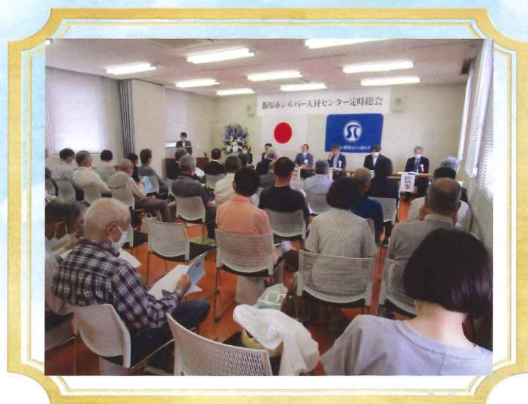
令和六年度定時総会開催の様子