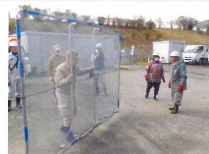
多くの参加者が体験されました

3月18日(月) 熊谷市にある熊谷市シルバーセンターにて、熊谷市シルバーセンターによる安全講習会を開催しました。安全講習会では、安全意識の向上を図る上で重要な役割を果たしています。