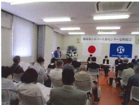
【上】大会議室の様子、【下】WEB会場の様子