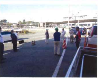
誤発進防止の实地指導

高齢者の交通事故防止に向けて、高齢者の交通安全第一課の指導員による、交通安全講習会を開催しました。交通安全講習会では、高齢者の交通事故防止に向けて、交通安全講習会を開催しました。交通安全講習会では、高齢者の交通事故防止に向けて、交通安全講習会を開催しました。