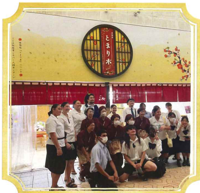
休憩処 とまり木オープン