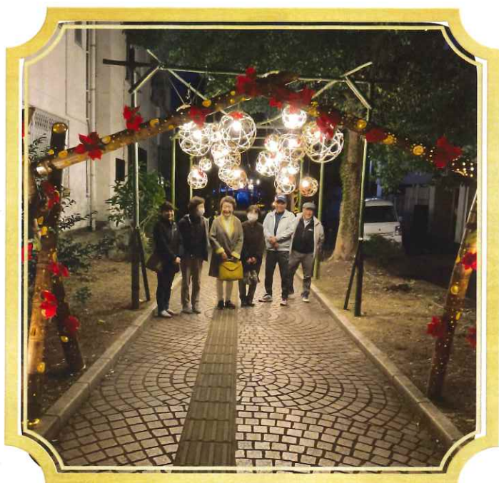
まちなかイルミネーション