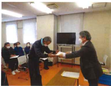
《令和6年度 安全表彰の様子》 草刈7班は5年連続表彰

※傷害事故が増加しています。就業途上や帰宅中は交通安全を心掛け、気を付けて就業して下さい。