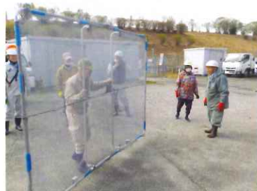
草刈講習会の様子