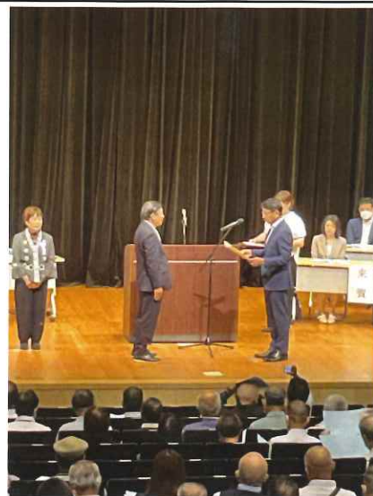
《福岡市東区なみきホールにて表彰式》

もし、自分の家で同じようなことが行われたら…と考えたら、憤りとともに二度とシルバー人材センターに仕事を頼もうとは思いませんよね。当センターにはこのような会員はいないと思いますが、センターの信用を失墜させるような行為があった場合は他の会員の仕事を奪いかねません。よってこのような行為があった場合には、安全・適正就業委員会として厳正に対処してまいります。