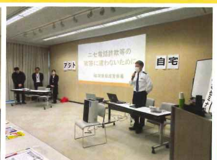
実際の犯人の肉声と被害者とのやりとりが公開されました