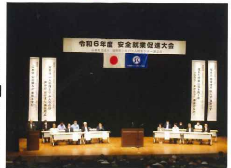
《令和6年度 安全就業促進大会》

安全就業促進大会とは… 年に一度、福岡県下の全センターが安全委員を代表に一同に会し各センターの取組みや表彰、事例発表を行い安全就業に努めることを再認識する大会。